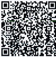
เอกสารประกอบการประชุม