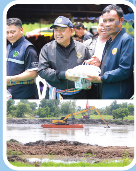
ติดตามงานและรับฟังบรรยาย การพัฒนาแหล่งน้ำลำน้ำดอกไม้ อ่างเก็บน้ำหนองหมาจอก บ้านลาดสระบัว ต.หัวจิว อ.ยางตลาด จ.กาฬสินธุ์

มอบโฉนดเพื่อการเกษตร และรับฟังปัญหาของเกษตรกร ในพื้นที่