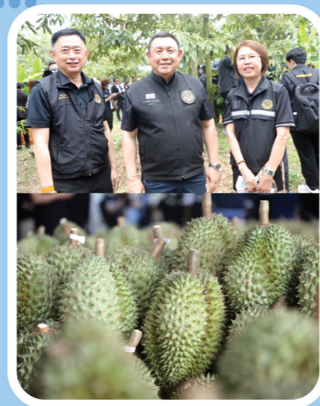
เยี่ยมชมกระบวนการตรวจสอบคุณภาพ ทุเรียนและรับรองคุณภาพอนามิยพิช และลงพื้นที่ศูนย์เรียนรู้กลุ่มเกษตรกรแปลงใหญ่ ทุเรียนตามระบบเกษตรปลอดภัย อ.นายายอาม/อ.ชลุง จ.จันทบุรี