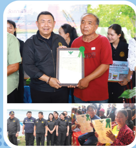
กาฬสินธุ์

ตรวจเยี่ยมโครงการส่งน้ำและบำรุงรักษาลำปาว พร้อมมอบโฉนดเพื่อการเกษตร ต.ลำคลอง อ.เมืองกาฬสินธุ์ จ.กาฬสินธุ์