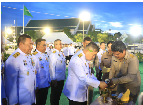
พิธีล้างมือพระยาแรกนา และเจิมหน้าพระโค