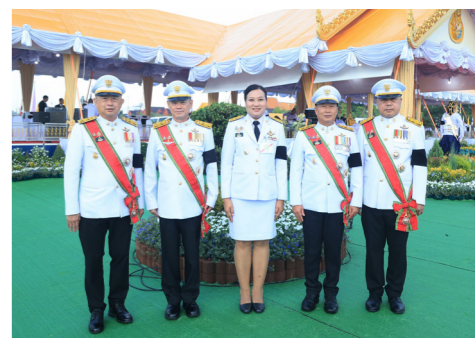
พระราชพิธีพืชมงคลจรดพระนังคัลแรกนาขวัญ ปีพุทธศักราช 2569