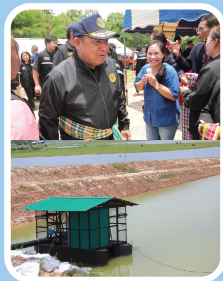
ตรวจราชการ ณ สถานีสูบน้ำบ้านแสนสำราญ ต.นาเชือก อ.ยางตลาด จ.กาฬสินธุ์

ตรวจเยี่ยมโครงการส่งน้ำและบำรุงรักษาลำปาว พร้อมมอบโฉนดเพื่อการเกษตร ต.ลำคลอง อ.เมืองกาฬสินธุ์ จ.กาฬสินธุ์