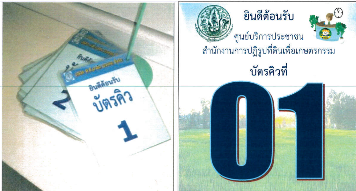
แบบตัวอย่างบัตรคิว

แบบตัวอย่าง บัตรคิว และ ตู้/กล่อง แสดงความคิดเห็น และใบแบบแสดงความคิดเห็นการให้บริการ