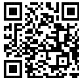
(นางสุภาวดี ระโยธี) ปฏิรูปที่ดินจังหวัดขอนแก่น